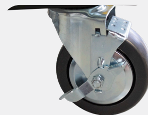
Roues avec frein de blocage