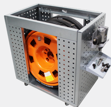
Exemple de composition

Ce chariot, de conception européenne, représente un gage de qualité et de respect des normes de fabrication strictes. Il est spécialement conçu pour le transport aisé de quatre roues universelles de type "guniwhel".