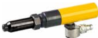
RV.EXTRACTOR EXTRACTEUR DE BROCHES M5

DISPOSITIF DE RIVETAGE POUR RIVETS À ECROUS